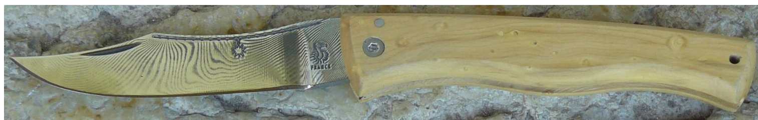
Manche : buis, vissé.