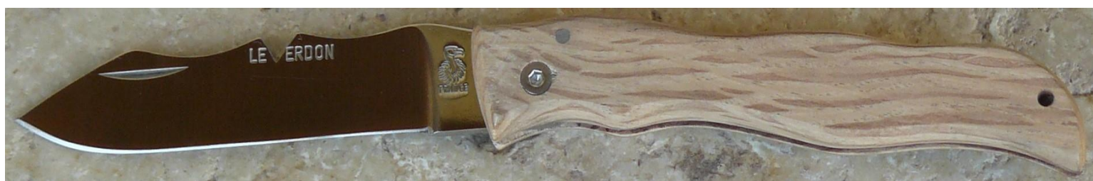
Manche : chêne vert, vissé.