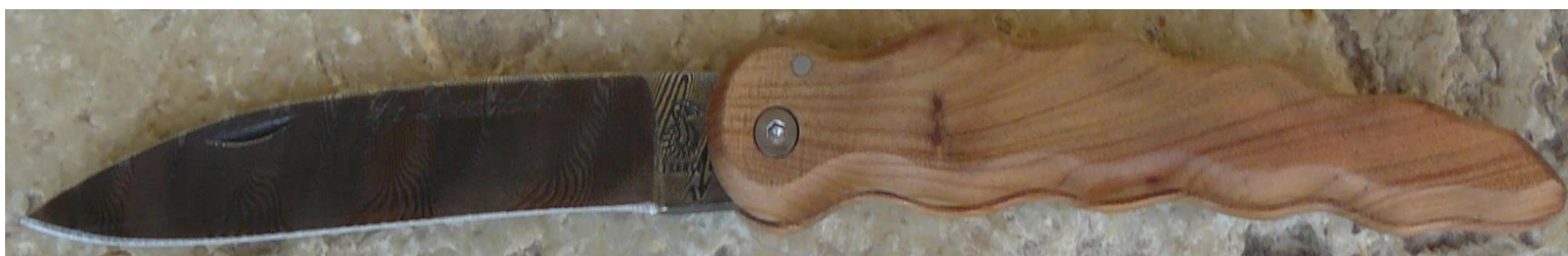
Manche : genévrier/cade ( Juniperus oxycedrus ), vissé.