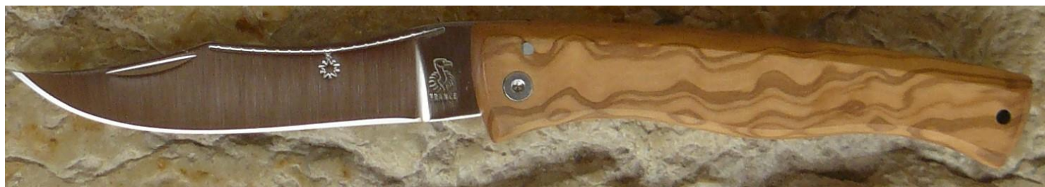
Manche : olivier, vissé.