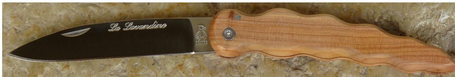
Manche : genévrier/cade ( Juniperus oxycedrus ), vissé.