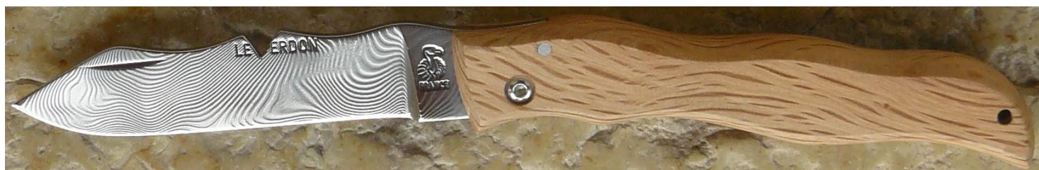
Manche : chêne vert, vissé.