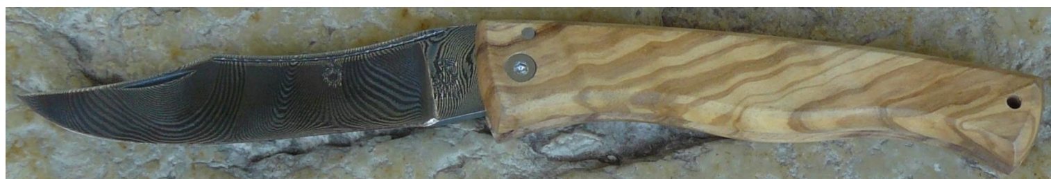
Manche : olivier, vissé.