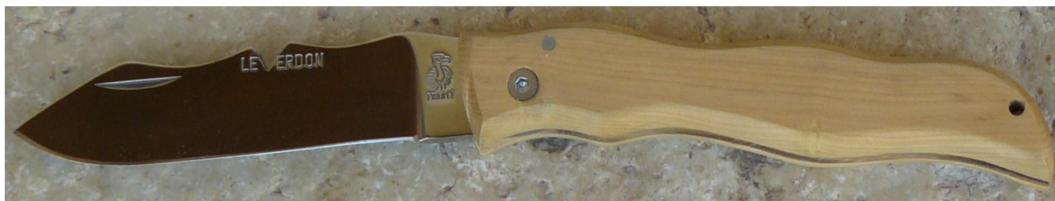
Manche : buis, vissé.