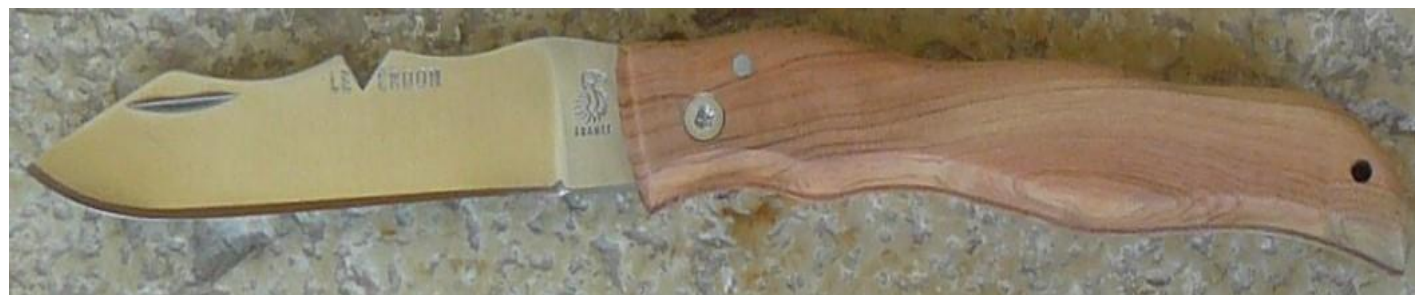
Manche : genévrier/cade ( Juniperus oxycedrus ), vissé.