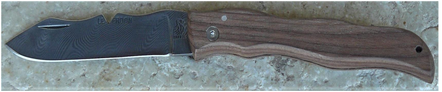
Manche : noyer, vissé.