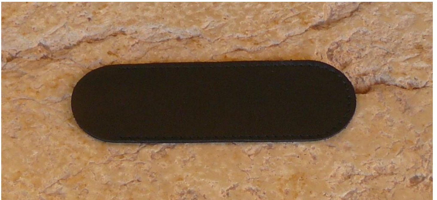
Couleur : noir.