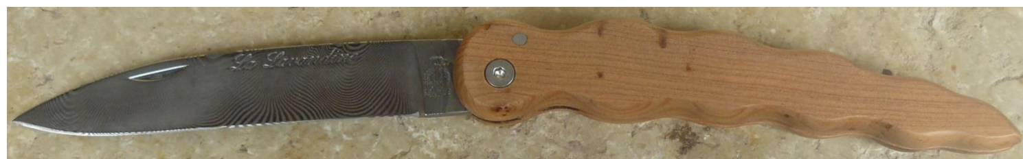
Manche : genévrier/cade ( Juniperus oxycedrus ), vissé.