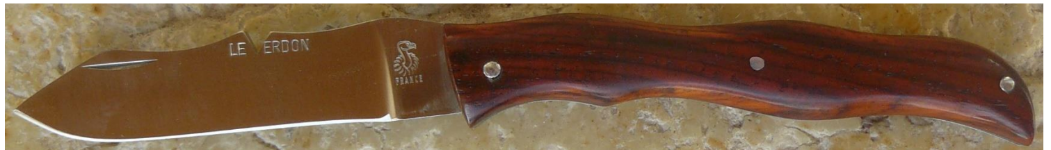
Manche : cocobolo du Costa Rica, riveté.