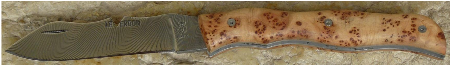
Manche : loupe de cade de Provence (83 ou 04), vissé.