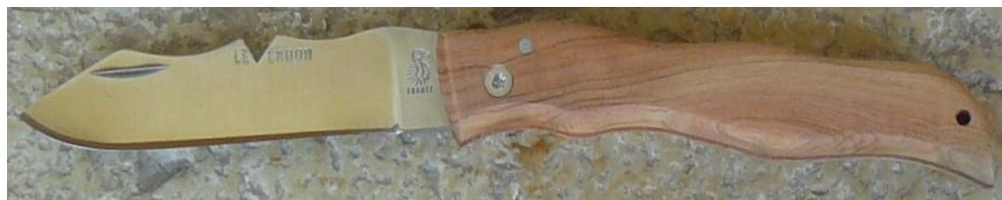
Manche : genévrier/cade ( Juniperus oxycedrus ), vissé.