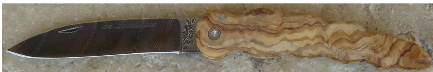
Manche : olivier, vissé.