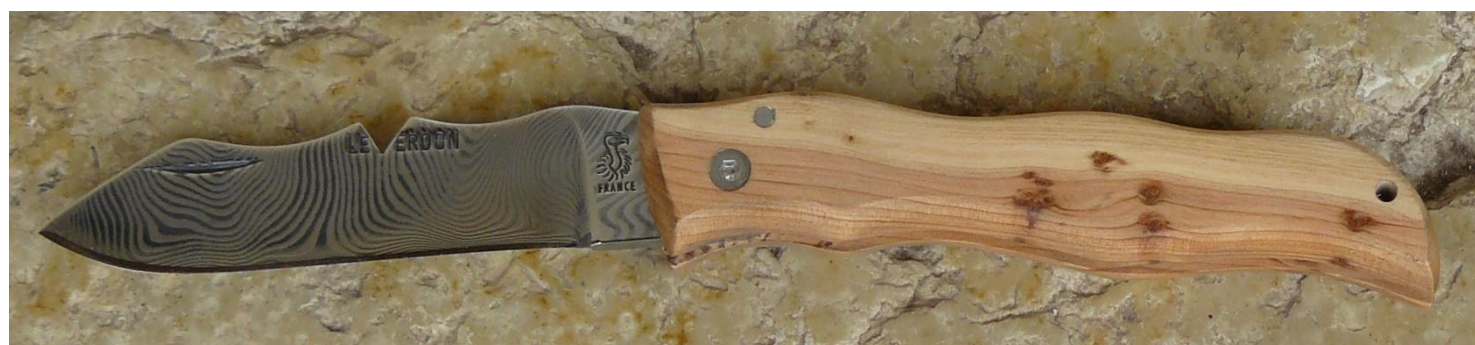
Manche : genévrier/cade ( Juniperus oxycedrus ), vissé.