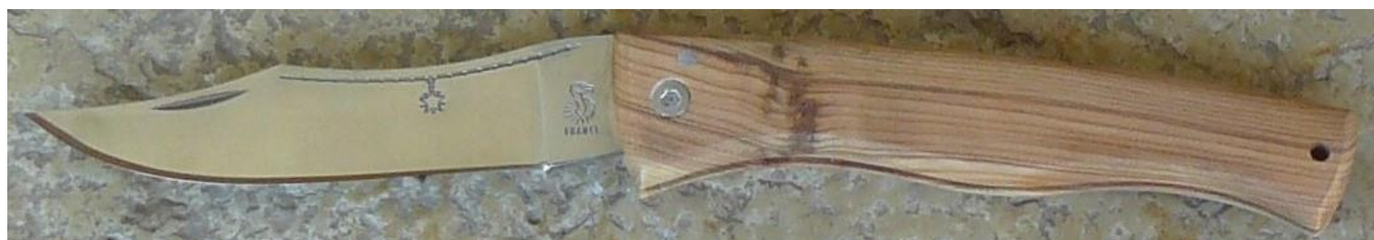
Manche : genévrier/cade ( Juniperus oxycedrus ), vissé.