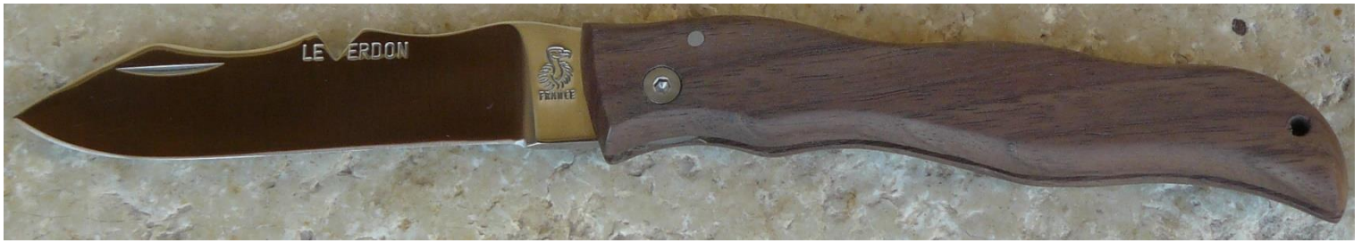
Manche : noyer, vissé.