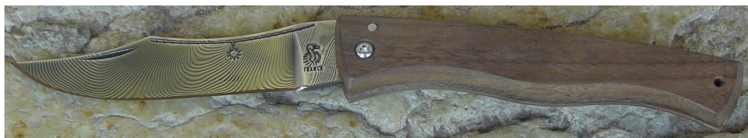
Manche : noyer, vissé.