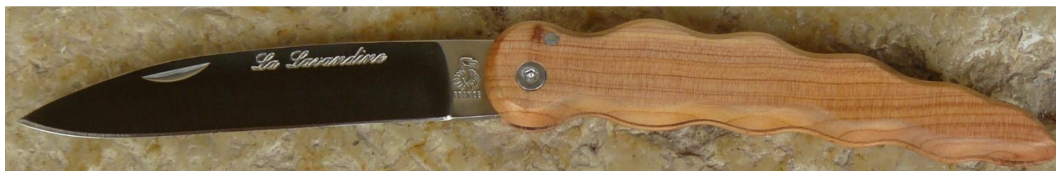
Manche : genévrier/cade ( Juniperus oxycedrus ), vissé.