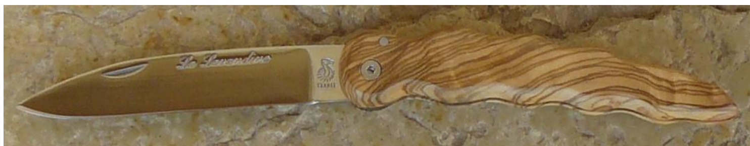
Manche : olivier, vissé.