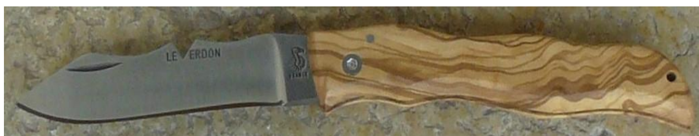
Manche : olivier, vissé.