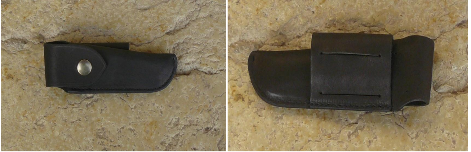
Couleur : noir.