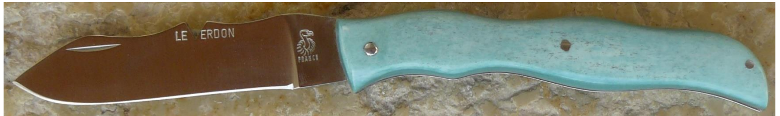
Manche : os de chameau stabilisé vert, riveté.