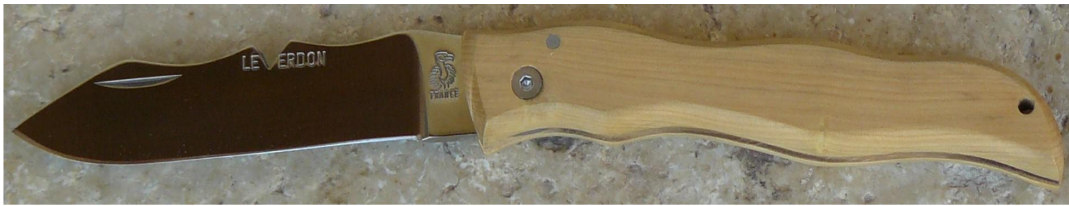
Manche : buis, vissé.