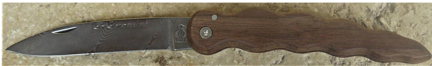
Manche : noyer, vissé.