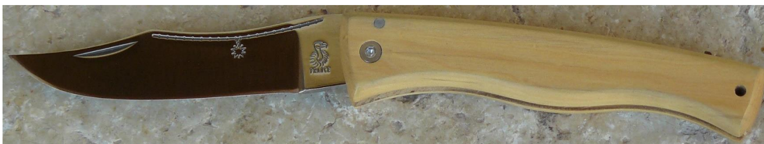
Manche : buis, vissé.