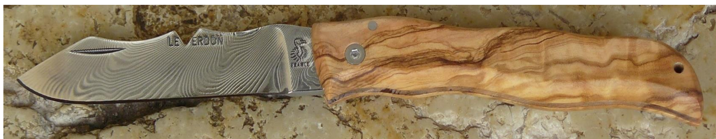
Manche : olivier, vissé.