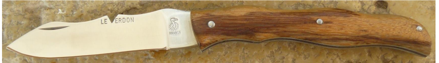
Manche : bois de serpent de Guyane, riveté.