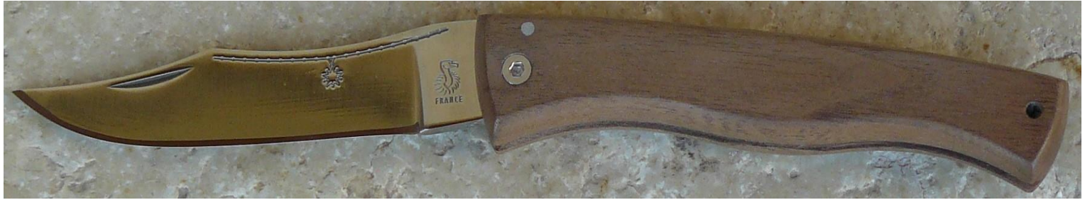
Manche : noyer, vissé.