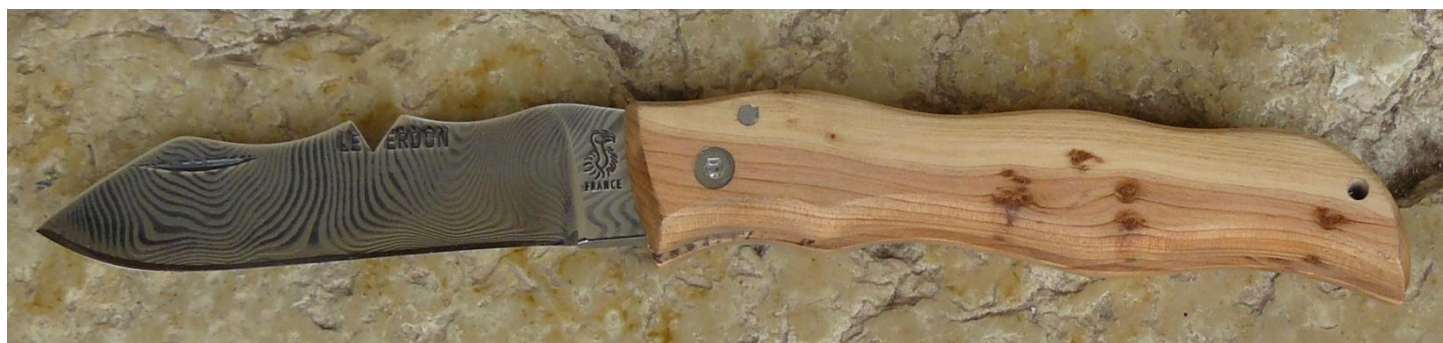
Manche : genévrier/cade ( Juniperus oxycedrus ), vissé.