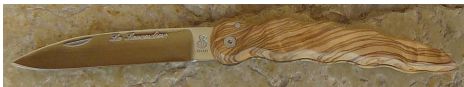
Manche : olivier, vissé.