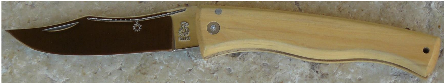
Manche : buis, vissé.