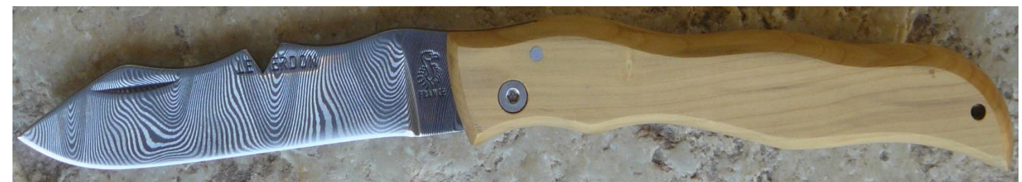
Manche : buis, vissé.