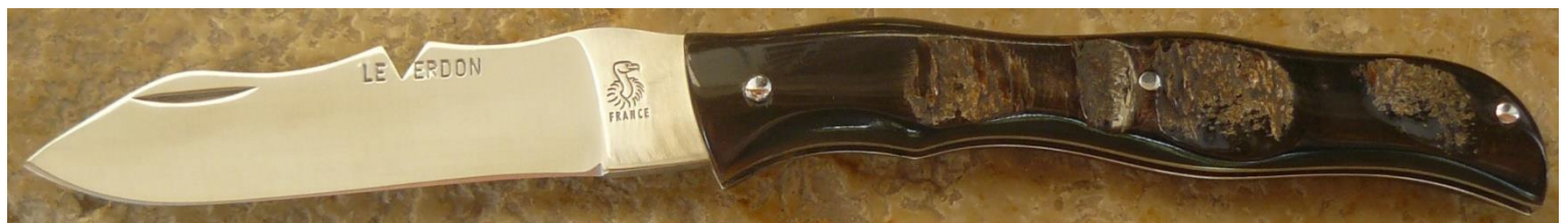
Manche : croûte de corne de buffle, riveté.