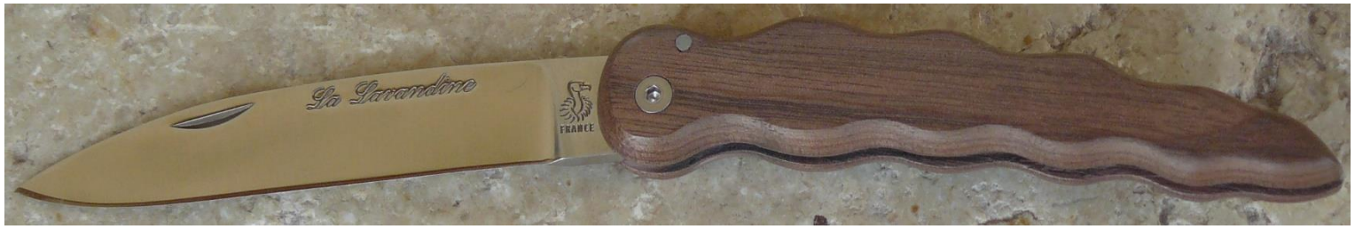
Manche : noyer, vissé.