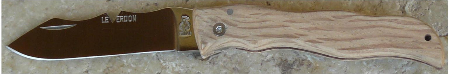
Manche : chêne vert, vissé.