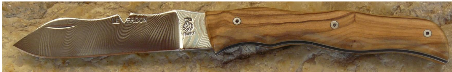
Manche : olivier de Provence (83 ou 04), vissé.