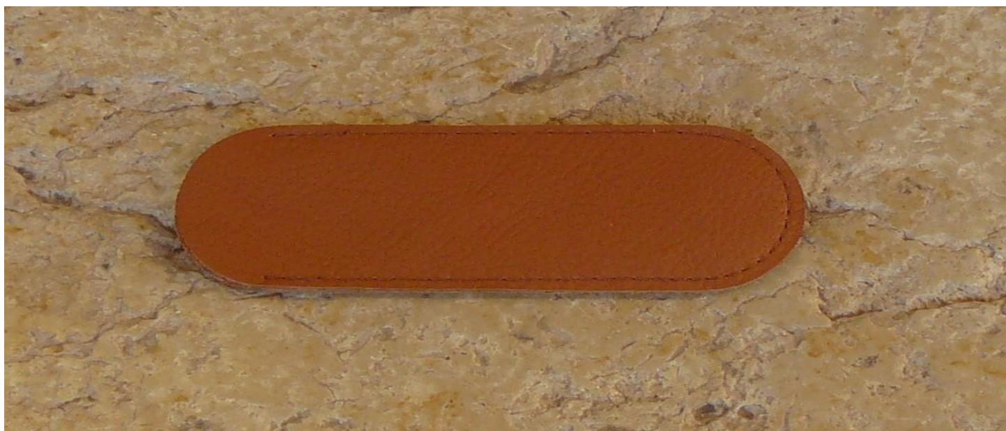
Couleur : marron clair.