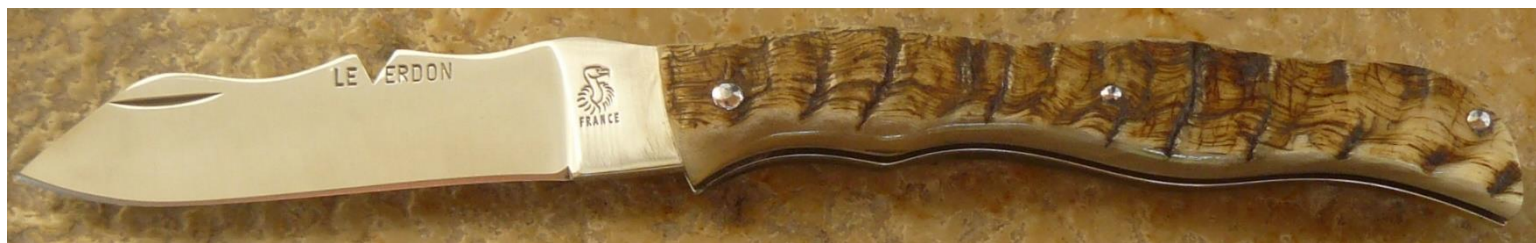
Manche : croûte de corne de bélier, riveté.