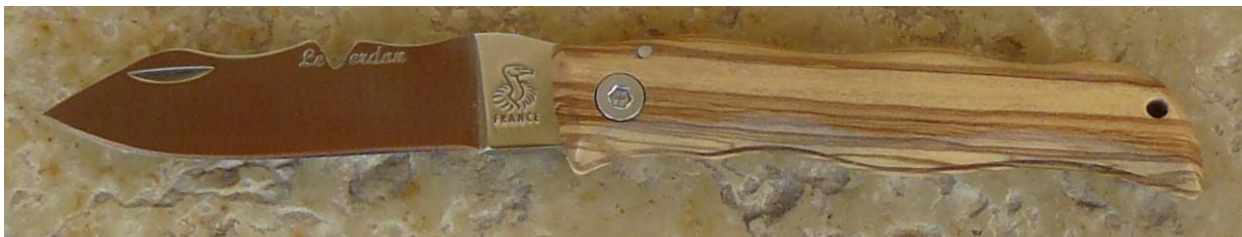
Manche : olivier, vissé.