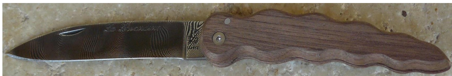
Manche : noyer, vissé.