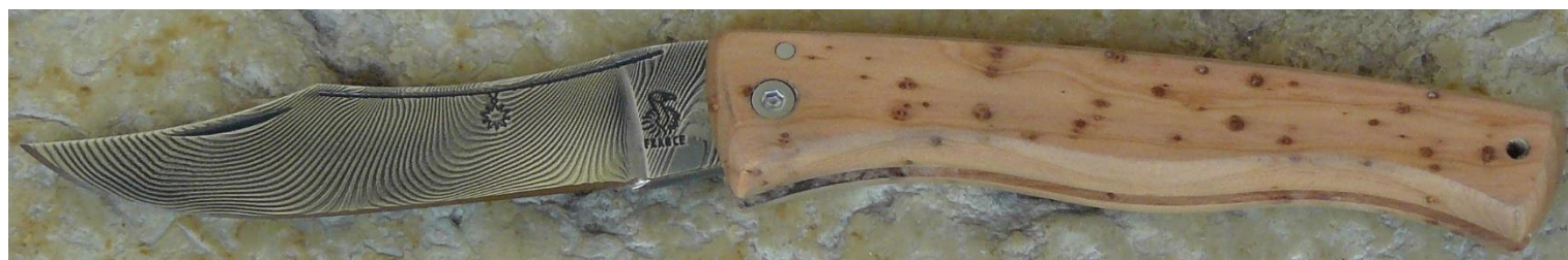
Manche : genévrier/cade ( Juniperus oxycedrus ), vissé.