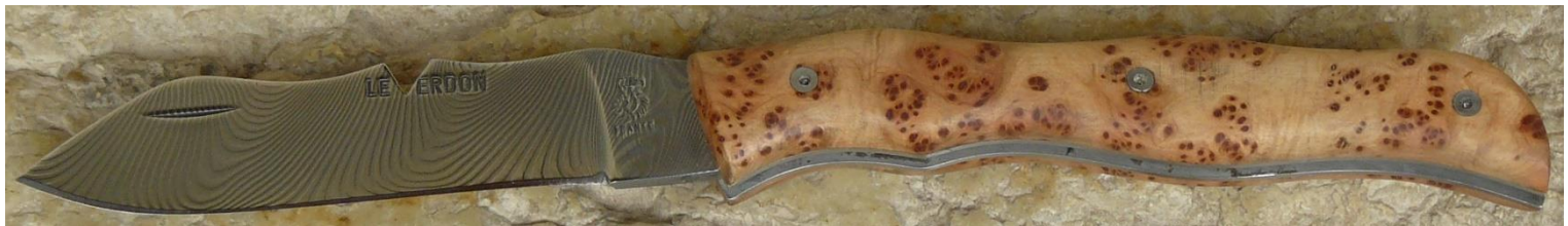
Manche : loupe de cade de Provence (83 ou 04), vissé.