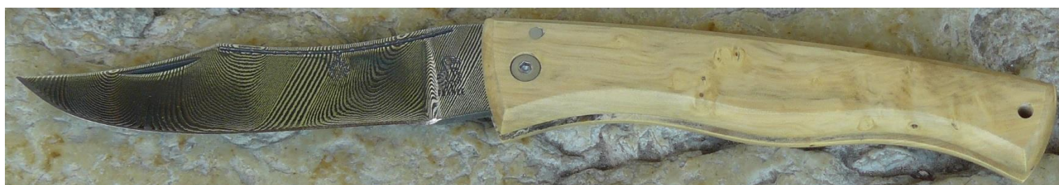
Manche : buis, vissé.