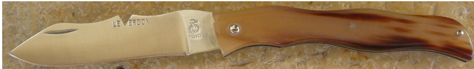
Manche : pointe de corne blonde de zébu, riveté.