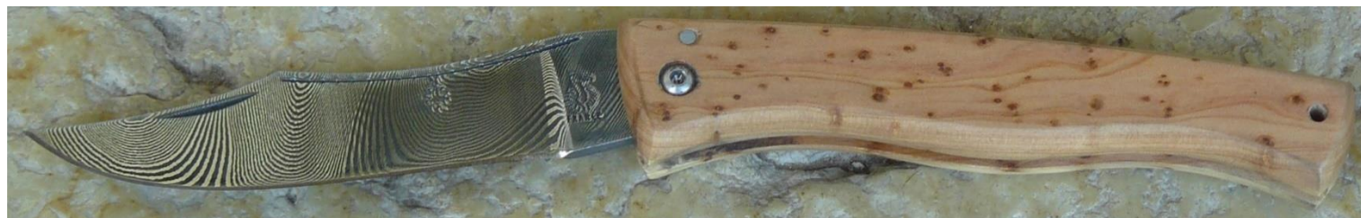
Manche : genévrier/cade ( Juniperus oxycedrus ), vissé. .