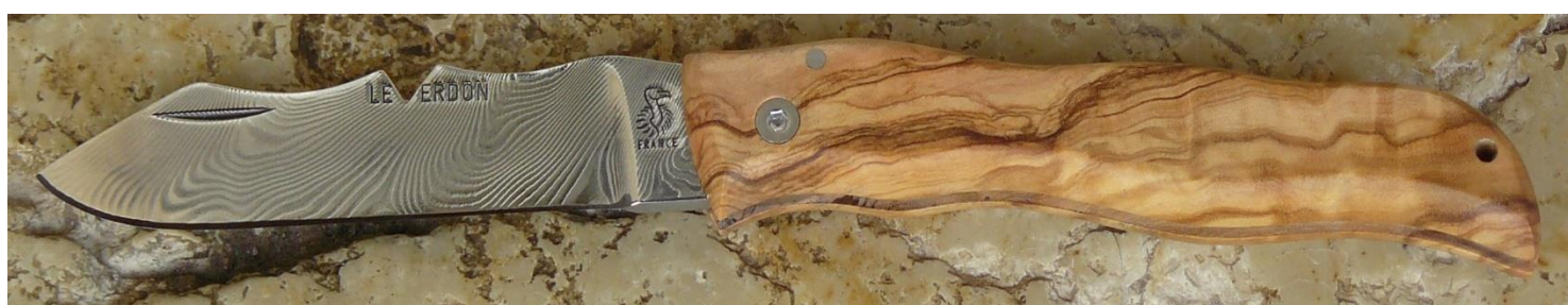
Manche : olivier, vissé.