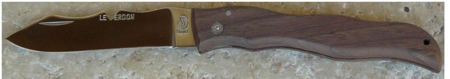
Manche : noyer, vissé.