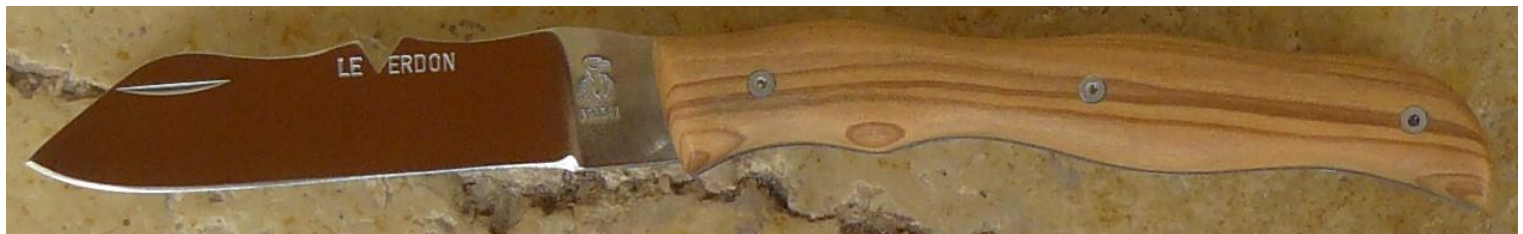
Manche : bois d'olivier de Provence, vissé.