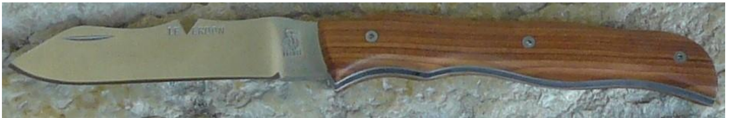
Manche : bois d'if de Provence, vissé.