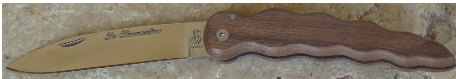
Manche : noyer, vissé.