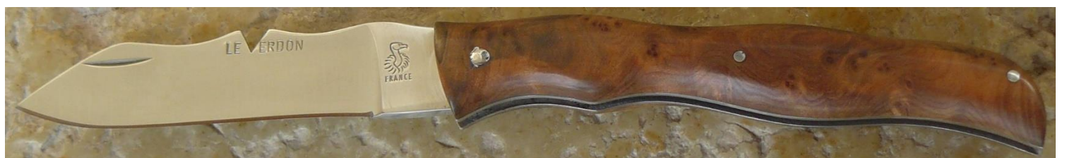
Manche : ronce de thuya du Maroc, riveté.