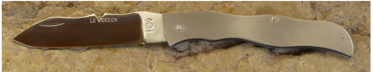
Le couteau une fois, plié, fermé