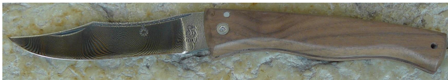
Manche : noyer, vissé.