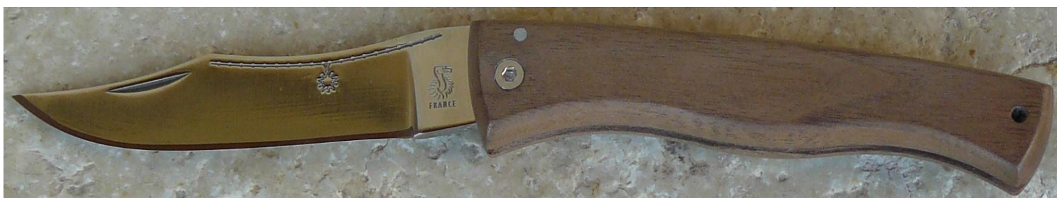
Manche : noyer, vissé.